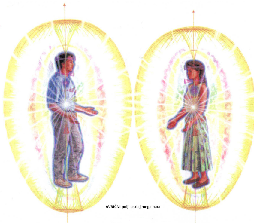
AVRIČNI polji usklajenega para